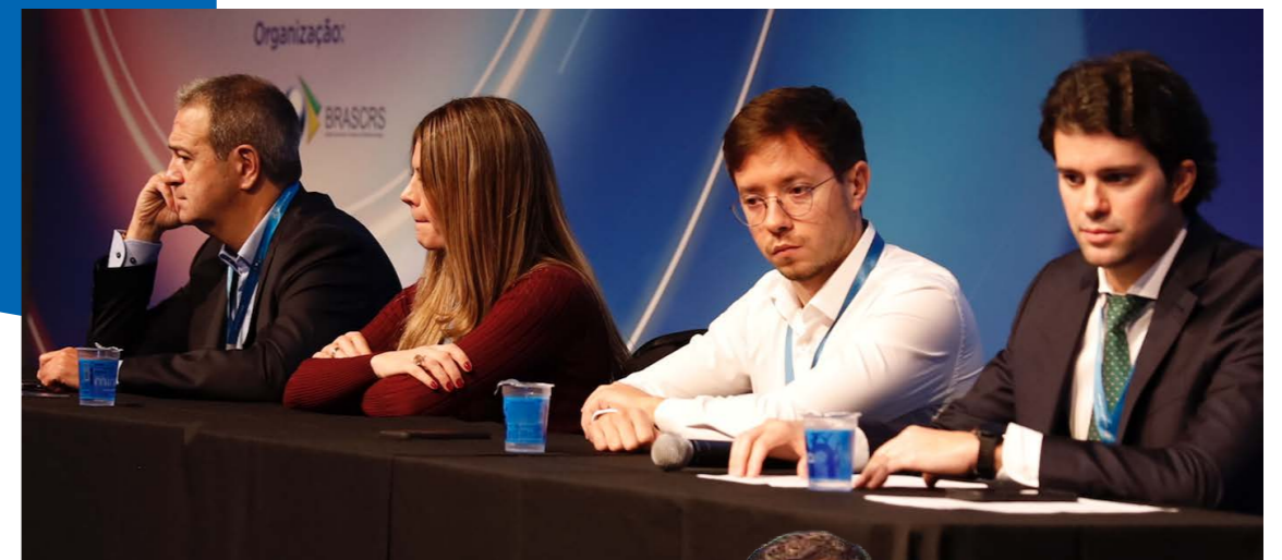
Tabus e fatos