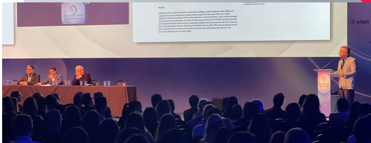
Controvérsias / Controversies / Controversias