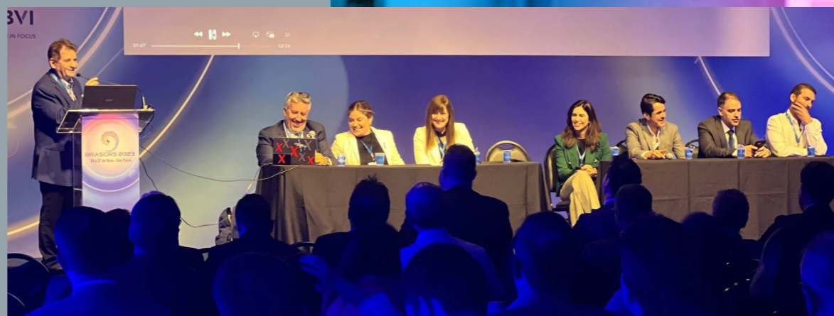
Desvendando casos extraordinários e desafiadores que irão conquistar o coração do auditório / Unraveling extraordinary and challenging cases that will win the heart of the audience / Desentrañar casos extraordinarios y desafiantes que ganarán el corazón de la audiencia