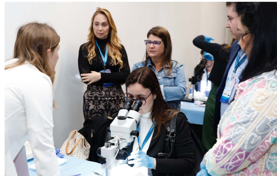
Prática na marcação de LIO tórica e implante Marking and implantation of Toric IOLs / Marcado e implante de LIO Tórica