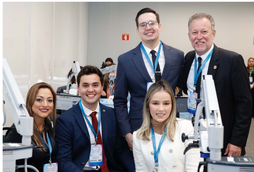
Anel expander de íris (Canabrava Ring) Iris expanding ring - Canabrava ring / Anillo expander del iris - Canabrava Ring