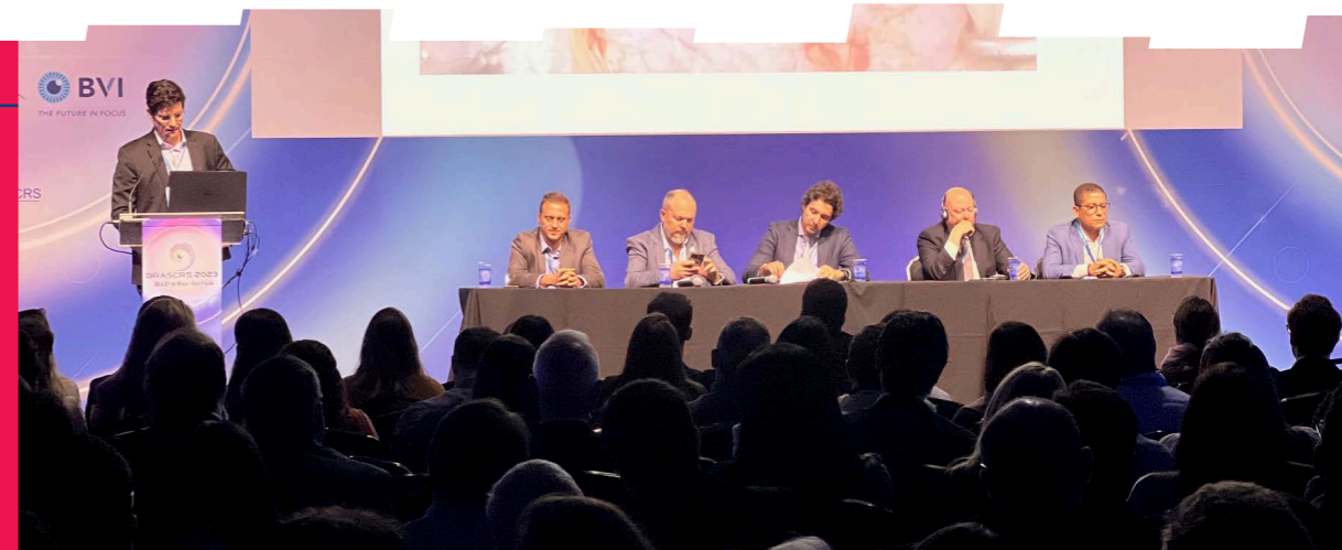
Como evitar e lidar com as complicações na FACO