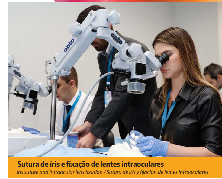
Sutura de íris e fixação de lentes intraoculares Iris suture and intraocular lens fixation / Sutura de Iris y fijación de lentes Intraoculares