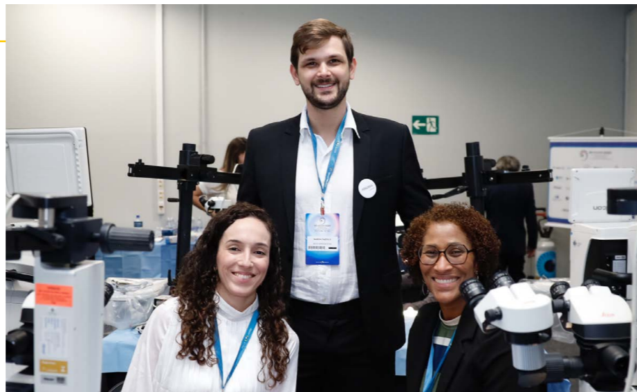
LIO Premium (montagem e implante) Premium IOLs (Mounting and IOL implantation) / LIO Premium (Ensamblando e implante de LIO)

Solo quien ha hecho un wet lab en la Asociación Brasileña de Catarata y Cirugía Refractiva conoce el estándar BRASCRS para transmitir conocimientos, en la teoría y en la práctica. Estos son algunos de los mejores momentos del segundo día del BRASCRS 2023 wet lab.